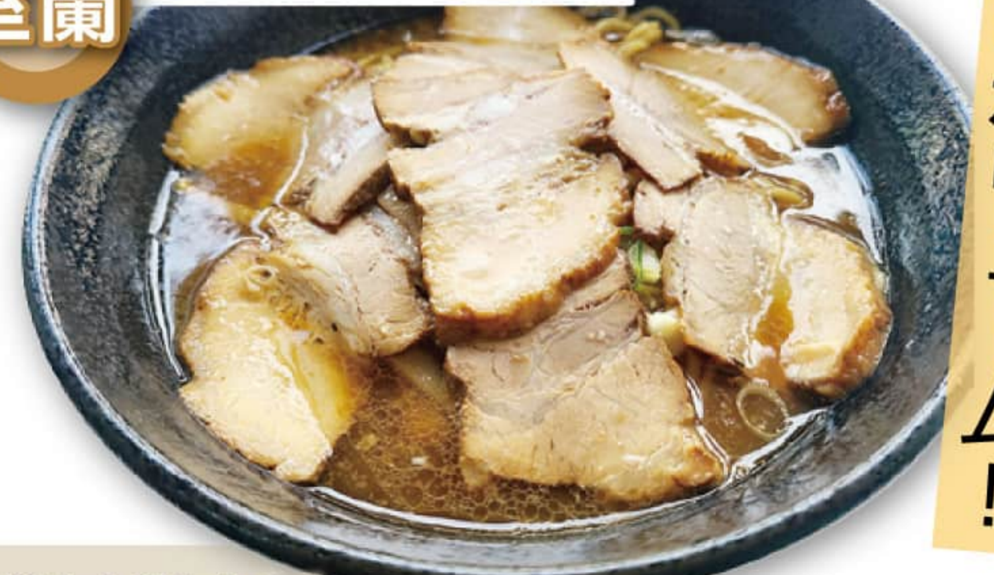
昨年12月に移転 リニューアルオープン! チャーシュー麺 正油 970円

室蘭市中島町 1-9-6 0143-46-2958 11:00~16:00 定休/水曜日