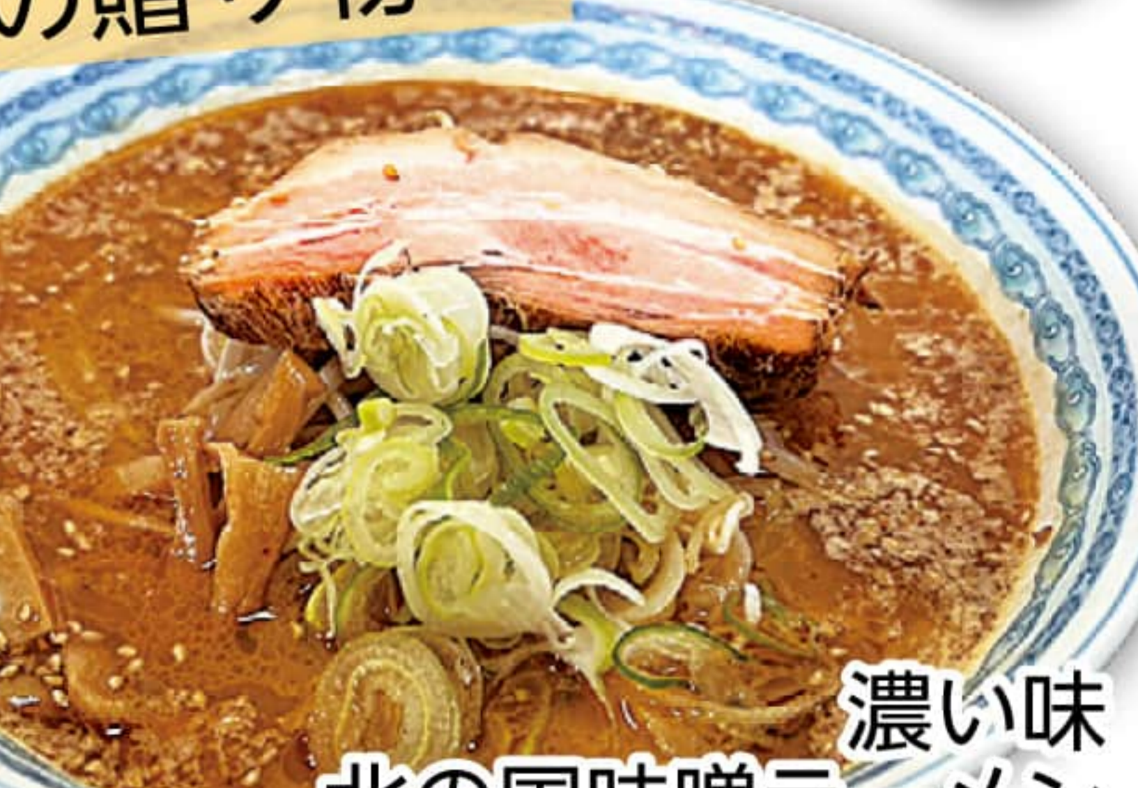
濃い味北の国味噌ラーメン 870円

室蘭市中島町 3-23-7 0143-43-5848 10:30~21:00 定休 / 水曜日 (祝日は営業いたします)