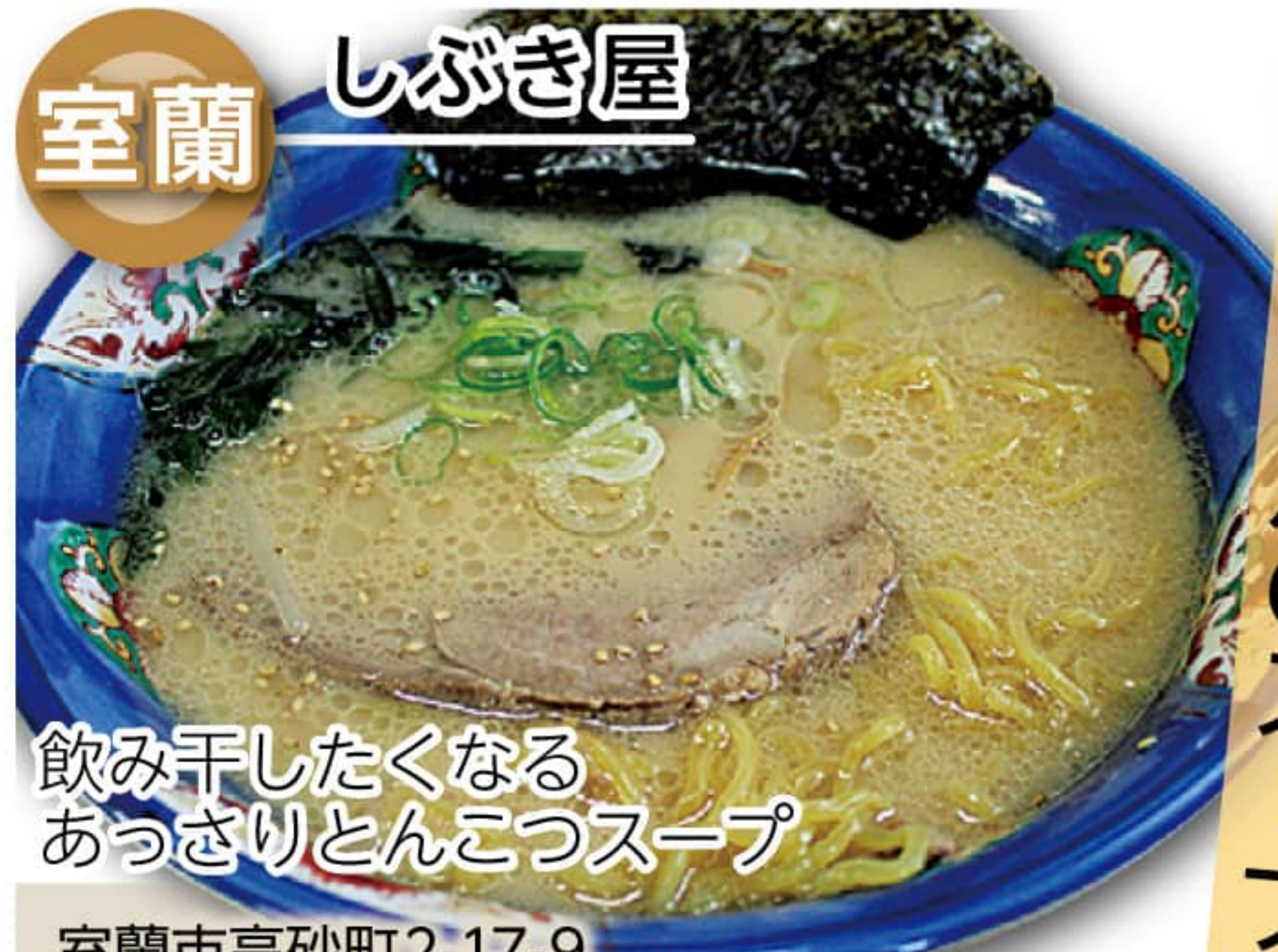
とんこつ塩ラーメン 800円

飲み干したくなるあっさりとしたとんこつスープ 室蘭市高砂町 2-17-9 0143-44-2611 11:30~20:30 定休 / 火曜日 (祝日の場合営業)