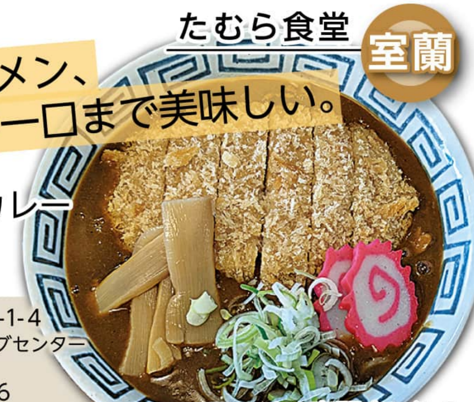
ラーメン専門店に迫る食堂こだわりの一杯

室蘭市白鳥台 5-1-4 白鳥台ショッピングセンターハック2F 0143-83-7426 11:00~14:00 定休 / 日曜日・月曜日