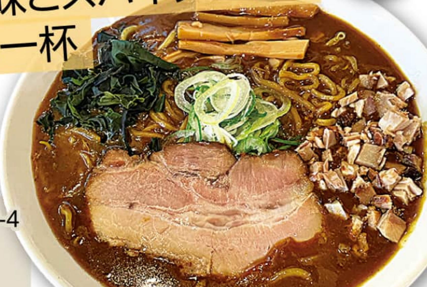
カレーラーメン 850円

室蘭市宮の森町 3-9-4 0143-47-2888 11:00~15:20 17:00~20:20 定休 / 月曜日