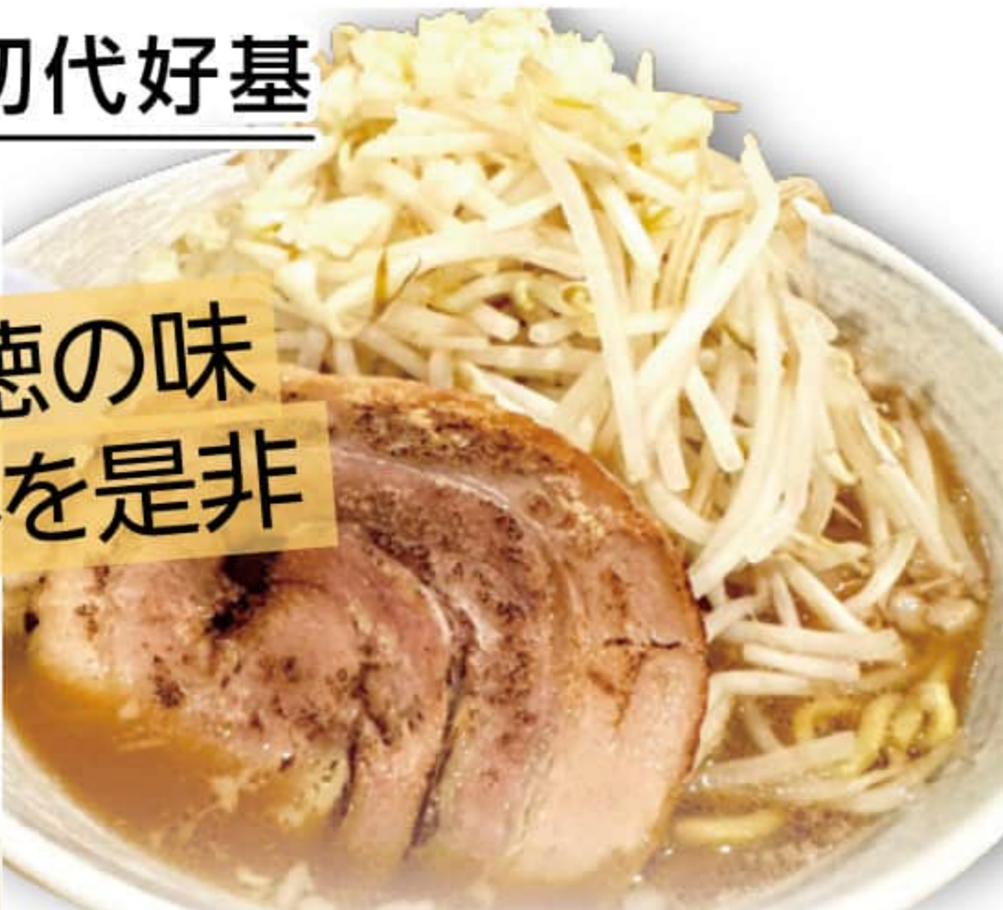
麺の小麦、野菜や肉、スープの骨、使用食材は全て店主厳選の国産素材使用。

室蘭市高砂町 5-17-18 来夢コーポF 080-1863-4894 昼の部 11:00~13:00 夜の部 17:00~20:30 定休 / 日曜・月曜日 (最終週のみ)