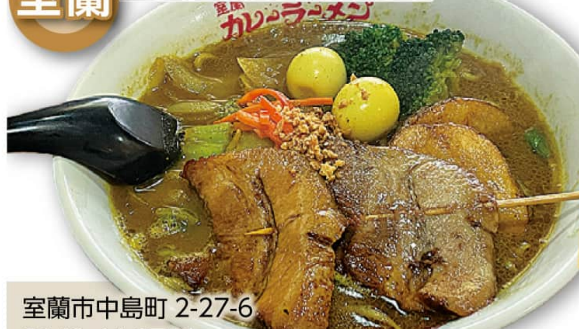
「室蘭やきとり風」の豚肉やうずら卵など名物がオールイン カレーラーメン 950円

室蘭市中島町 2-27-6 0143-44-8736 11:00~オーダー ストップ 13:30 定休 / 月曜・火曜日