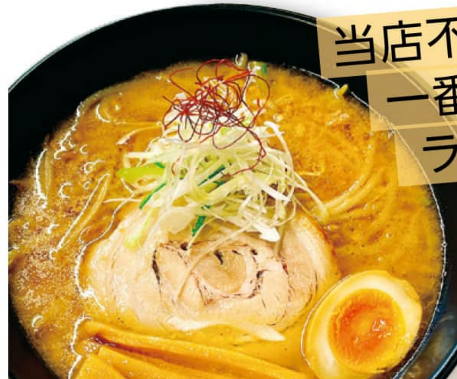
鉄灯麦味噌ラーメン 880円

室蘭市中島本町 1-4-4 モルエ中島 1階 0143-47-3900 11:00~19:30 無休