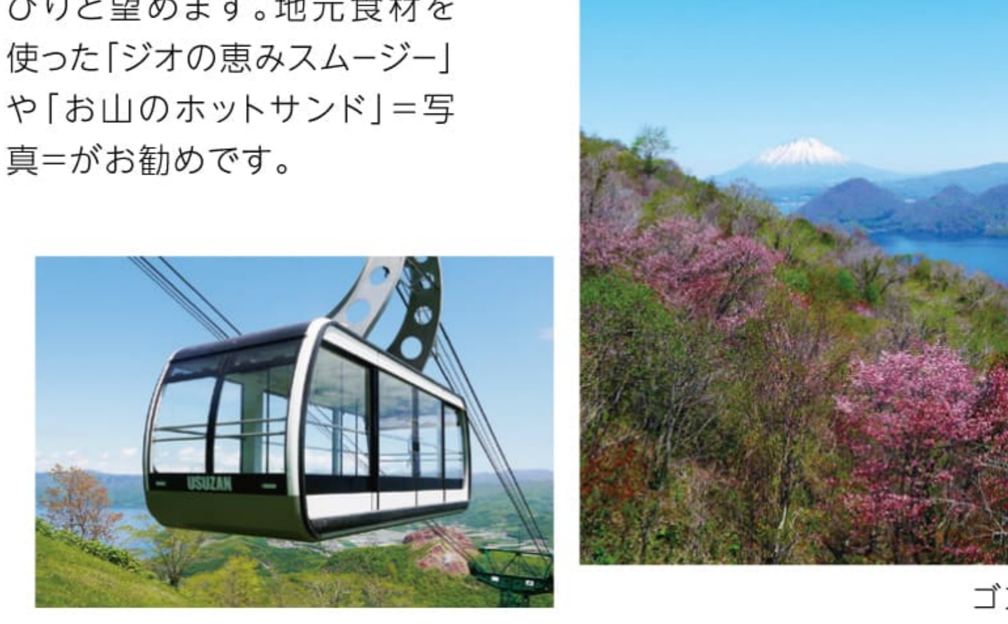
最大96名乗りのスイス製ゴンドラ